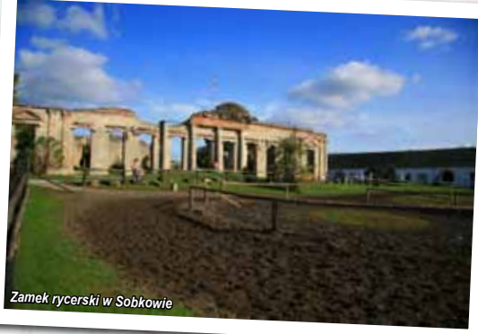
Zamek rycerski w Sobkowie

W II poł. XVI w. Stanisław Sobek z Sulejowa herbu Brochwicz, kasztelan sandomierski i podskarbi koronny rozpoczął nad Nidą budowę zamku oraz założył miasto – Sobków. Do czasów współczesnych zachowała się spora część fortyfikacji, które zagospodarowano w bardzo atrakcyjny dla turystów sposób. Znajduje się tu obecnie restauracja oraz hotel, który oferuje niezapomniane przeżycie, jakim jest nocleg w najprawdziwszych komnatach znajdujących się w miejscu dawnego skarbcza.