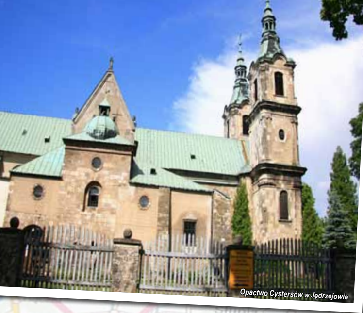
Opactwo Cystersów w Jedrzejowie