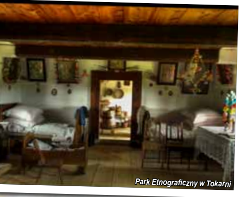
Park Etnograficzny w Tokarni

Zmierzając dalej drogą E7 w stronę Kielc, trudno nie zauważyć górującego ponad lasem wiatraka. Znajduje się on na terenie Parku Etnograficznego w Tokarni. Na ponad 65 ha, w otoczeniu zbliżonym do pierwotnego, umiejscowiono najcenniejsze zabytki budownictwa wiejskiego, dworskiego i małopolskiego typowego dla ziemi kieleckiej. Znajdują się tu przysiółki, zagrody wiejskie z pełnym wyposażeniem pochodzącym z okresu od XVIII do XX w, zabudowania dworskie, kościoły, karczma, spichlerz, wiatraki. Spacer po skansenie to prawdziwa podróż w czasie. Dzięki niezwyklej dbałości o najdrobniejsze szczegóły, w pełni oddano urok i niepowtarzalny klimat wsi kieleckiej.