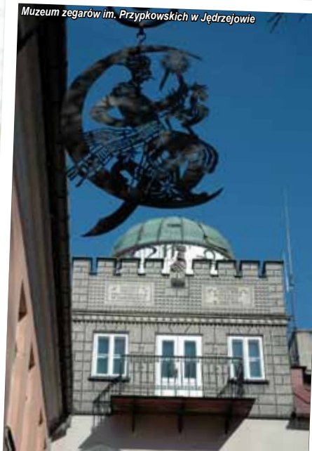
Muzeum zegarów im. Przytkowskich w Jedrzejowie

Zachwycają wspaniałe ołtarze, barokowe polichromie i organy , które są niezwykle cennym zabytkiem sztuki organowej . Co roku latem w klasztorze odbywa się Międzynarodowy Festiwal Muzyki Organowej i Kameralnej. W prezbiterium znajduje się ołtarz główny kościoła pochodzący z 1731 r. Kaplica boczna zawiera relikwie bł. Wincentego Kadłubka , który po zrzeczeniu się godności biskupa krakowskiego przywędrował pieszo do jedrzejowskiego klasztoru, gdzie spędził ostatnie lata życia.