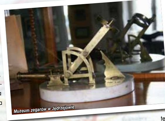
Muzeum zegarów w Jedrzejowie