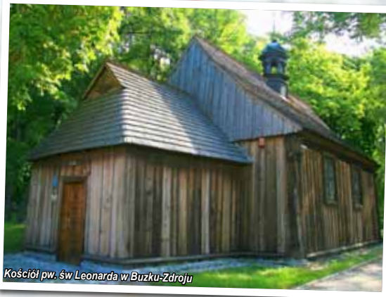
Kościół pw. św. Leonarda w Busku-Zdroju

Przy poparciu ówczesnych władz Rzewuski zakłada spółkę, która angażuje znanego architekta Henryka Marconiego aby wznosił łaźni z 66 wan-