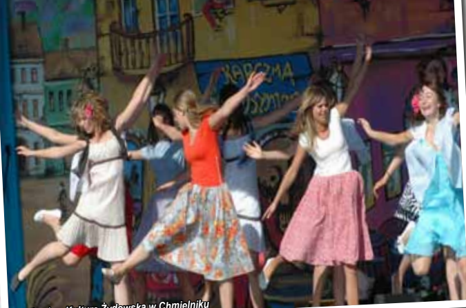
Spotkania z Kulturą Żydowską w Chmielniku

Odwiedzając Chmielnik, poza murami starej Synagogi, warto zobaczyć parafialny kościół pw. Niepokalanego Poczęcia NMP, pochodzący z XVIII w. oraz późnobarokowy kościółek pw. Świętej Trójcy z począt-