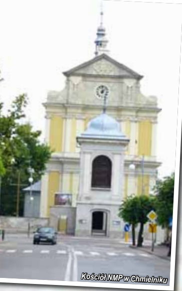
Kościół NMP w Chmielniku