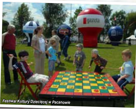
Festiwal Kultury Dziecięcej w Pacanowie

Największą sławę miastu przyniósł jednak brodaty mieszkaniec Pacanowa – sławny w całym kraju Koziołek Matołek , który narodził się pod piórem Kornela Makuszyńskiego. To pod jego patronatem już od kilku lat organizowane jest wielkie święto dzieci – Festiwal Kultury Dziecięcej , który co roku przyciąga do Pacanowa tysiące dzieci i dorosłych. Na początku 2010 r. zostanie otwarte Europejskie Centrum Bajki , miejsce, w którym urzeczywistnią się dziecięce bajkowe marzenia.