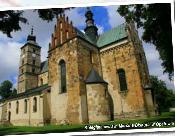
Kolegiata pw. św. Marcina Biskupa w Opatowie

Pierwotna osada , wczesnosłowiański gród, znajdowała się prawdopodobnie w pobliżu obecnego klasztoru Bernardynów. Funkcjonowała ona pod nazwą Żmigród . Władca opola żmigrodzkiego przyjął religię chrześcijańską, która była początkowo religią najwyższej władzy, zaś przybycie go grodu mni-