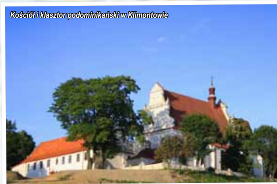
Kościół i klasztor poddominikański w Klimontowie

Kolejnymi właścicielami byli Morsztynowie, Senguszkowie, Denhoffowie, Leduchowscy.