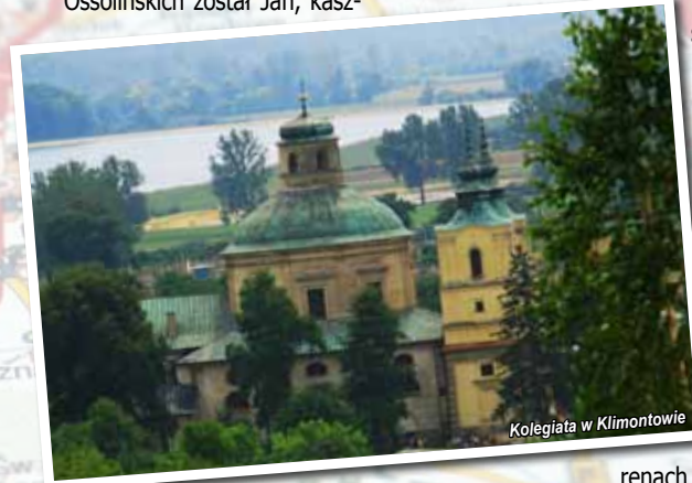
Kolegiata w Klimontowie