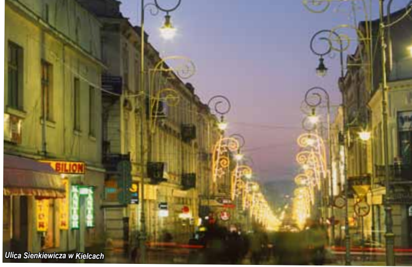
Ulica Sienkiewicza w Kielcach

Po zniszczeniu miasta w czasie wojen szwedzkich i ogólnym kryzysie gospodarczym nastąpił okres stagnacji na blisko 100 lat. Podjęte przez biskupów próby podźwignięcia miasta z upadku spełniły na niczym. Na skutek decyzji Sejmu Czteroletniego w roku 1789 Kielce wraz z dobrami biskupimi, przeszły na własność skarbu państwa. W 1805 r. , decyzją papieża Piusa VII utworzono diecezję kielecką . Rok 1816 był ważnym dla Kielc, jako że miasto stało się ośrodkiem administracyjnym w Królestwie Polskim , co zdecydowanie podniosło jego rangę.