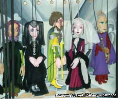
Muzeum Zabawek i Zabawy w Kielcach

wazony pochodzące z klasztornego ogrodu w Jędrzejowie oraz kilka pomników m.in. figura św. Jana Nepomucena, pomnik Stanisława Staszica czy Stefana Żeromskiego.