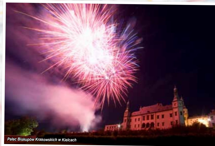
Pałac Biskupów Krakowskich w Kielcach

Jeden z najstarszych i piękniejszych parków w kraju . Usytuowany jest na ponad 7 ha w samym centrum miasta. Powstał w latach 30-tych XIX w. W zachodniej części parku znajdują się staw , którego największą atrakcją jest znajdująca się na środku fontanna z ozdobnymi dyskami w kształcie ryb. Ozdobą parku poza wypielegnowaną zielenią są barokowe rzeźby, kamienne