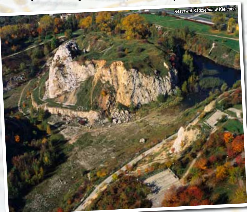
Rezerwat Kadzielnia w Kielcach

Tak o początkach Kielc głosi legenda. Historia zaś, a raczej badania archeologiczne potwierdzają w sposób jednoznaczny istnienie osady nad Silnicą w IX w. Najwcześniejsze wzmianki o osadzie targowej pochodzą z 1084 r. , jest to także data wybudowania pierwszego kościoła p.w. św. Wojciecha . Na przełomie XI/XII w. Kielce oraz dobra tysogórskie były już we władaniu biskupów krakowskich. Prawa miejskie nadano Kielcom prawdopodobnie w roku 1295, inne źródła wspominają rok 1360 i osobę biskupa Bodzantę. Potwierdzony jest jednak fakt nadania Kielcom przez kardynała Fryderyka Jagiellończyka w roku 1493 herbu, przedstawiającego na czerwonej tarczy złotej korony i złotych liter CK. W kolejnych wiekach miasto prędko się rozwija. W XIV w. rozpoczęła się na szeroką skalę eksploatacja pokładów rud żelaza, w pobliżu miasta powstały liczne kuźnie, kuźnice i zakłady hutnicze . Rozwija się również rzemiosło , do miasta napływa coraz więcej ludności. Kielce rozrastają się, powstaje ratusz, szkoła, łaźnia oraz zajazd dla odwiedzających miasto gości. Organizowano targi oraz kilka razy do roku duże jarmarki .