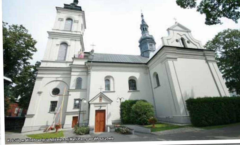
Kościół pw. Wniebowzięcia Najświętszej Marii Panny we Włoszczowie

Do najważniejszych pozostałości dawnych czasów należy leżący w północno-wschodniej części miasta kopiec . Jest to pozostałość wczesnośredniowiecznego grodziska opolnego .