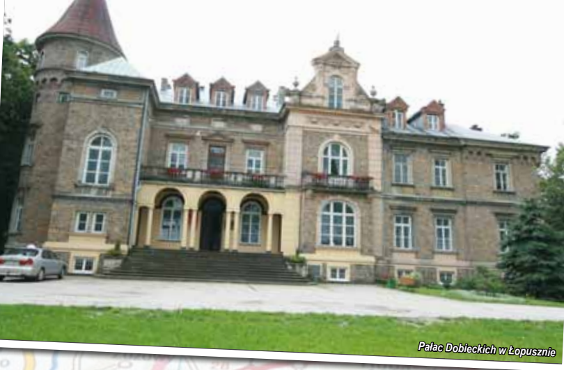
Pałac Dobieckich w Łopusznie

przedstawiciele w XIX w. wzniesli w Łopusznie swoją rezydencję. Jest to okazaly pałac , który powstał według projektu znanego architekta Henryka Marconiego . Obecnie mieści się w nim Liceum Ogólnokształcące.