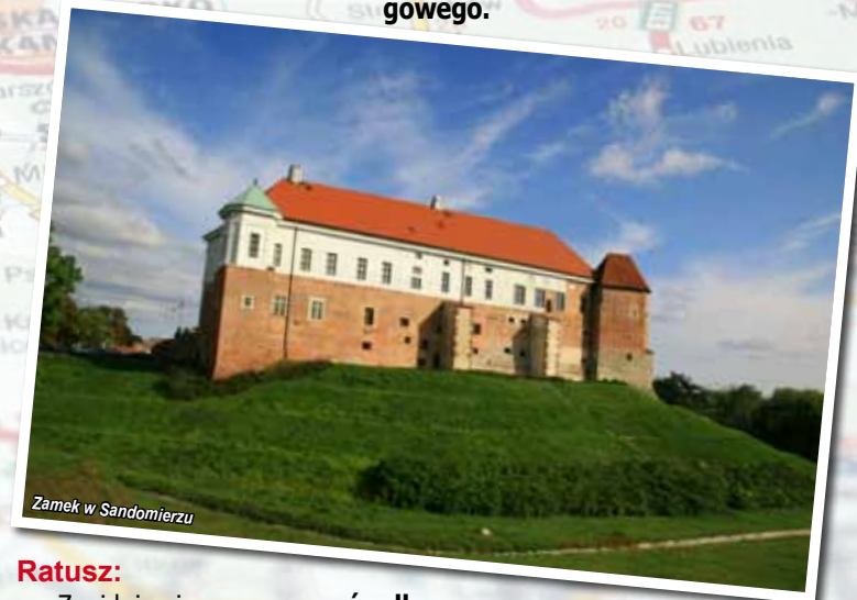
Zamek w Sandomierzu

Wniesiony został, podobnie jak mury obronne, za rządów Kazimierza Wielkiego . Położony jest na Wzgórzu Zamkowym i powstał w miejscu istniejącego tu w X w. grodu. Przebudowa w XVI w. nadała mu renesansowy charakter . O ogromnym zniszczeniu uległ w czasie potopu szwedzkiego , kiedy to został wysadzony w powietrze. Zachowało się jedynie zachodnie skrzydło zamku . Od I poł. XIX w. aż do lat 50-tych XX w. znajdowało się w nim więzienie, zaś obecnie jest siedzibą Muzeum Okręgowego .