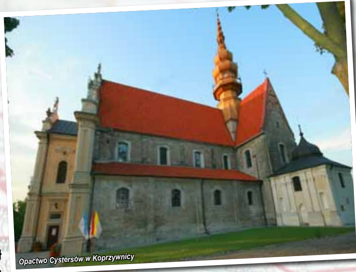
Opactwo Cystersów w Koprzywnicy

Na rozwój miasta wpływ miało nie tylko korzystne usytuowanie nad Wisłą i Sanem, które stanowiły dogodne szlaki komunikacyjne , ale przede wszystkim urodzajne gleby lessowe , które sprzyjały rozwojowi rolnictwa. We wczesnym średniowieczu Sandomierz był jednym z najważniejszych ośrodków gospodarczych i duchowych kraju . Był przystanią na szlaku handlowym ciągnącym się z południa, z Cesarstwa Rzymskiego, przez Kraków do Halicza i Kijowa.