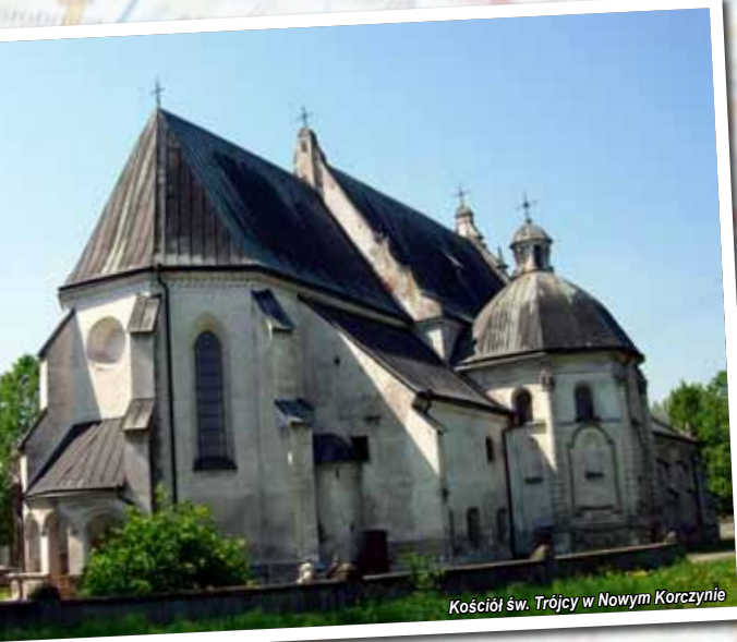
Kościół św. Trójcy w Nowym Korczynie

Początków miejscowości, należy szukać na prawym brzegu rzeki Nidy tam, gdzie obecnie leży wieś zwana Starym Korczynem . Jej początki sięgają XI w. gdy znajdował się tu gród wczesnopiastowski oraz siedziba książęcego dworu. W 1226 r. W tymże Korczynie przyszedł na świat Bolesław Wstydlivy, przyszyły książę krakowski. Do XII w. ta niewielka miejscowość leżąca na prawym brzegu Nidy jest silnym ośrodkiem władzy politycznej w kraju . Traci potem jednak na znaczeniu na rzecz nowo powstałej miejscowości