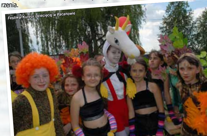
Festiwal Kultury Dziecięcej w Pacanowie

Największą sławę miastu przyniósł jednak brodaty mieszkaniec Pacanowa – sławny w całym kraju Koziołek Matołek , który narodził się pod piórem Kornela Makuszyńskiego . To pod jego patronatem już od kilku lat organizowane jest wielkie święto dzieci – Festiwal Kultury Dziecięcej , który co roku przyciąga do Pacanowa tysiące dzieci i dorosłych . Na początku 2010 r. zostanie otwarte Europejskie Centrum Bajki - miejsce, w którym urzeczywistnią się dziecięce bajkowe marzenia.