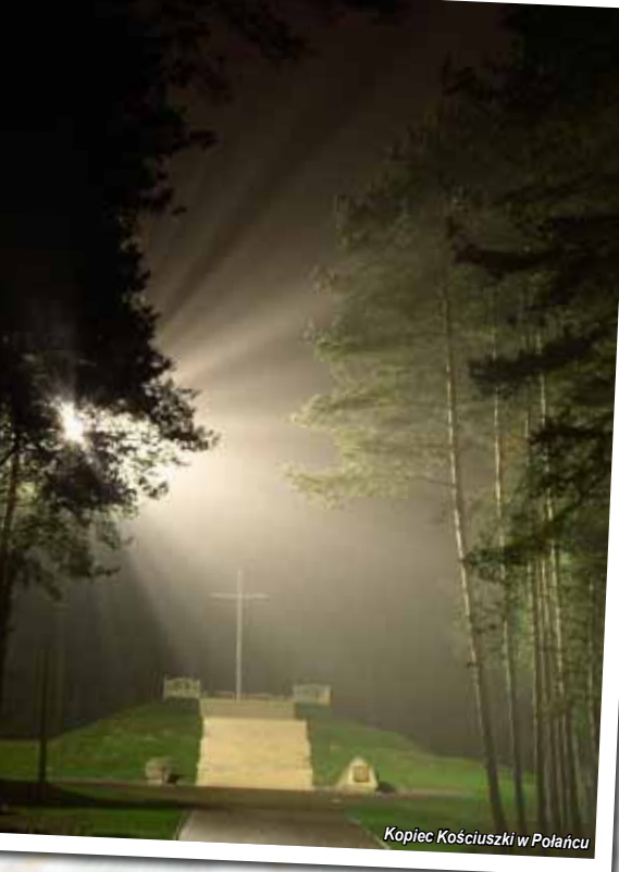
Kopiec Kościuszki w Połaniecu

Przez kolejne stulecie miasto brało czynny udział w handlu wiślanym. Sporą rolę odegrał również na arenie politycznej. Bowiernie to właśnie tu, w 1794 r., Tadeusz Kościuszko wydał słynny Uniwersał Połaniecki , który w sposób jednoznaczny regulował problem chłopów i pańszczyzny. Najbardziej prężny rozwój miasta nastąpił jednak dopiero w czasach współczesnych, kiedy to w na początku lat 70-tych XX w. rozpoczęto budowę elektrowni.