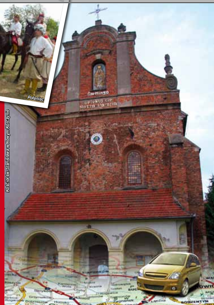
Kościół św. Stanisława w Nowym Korczynie