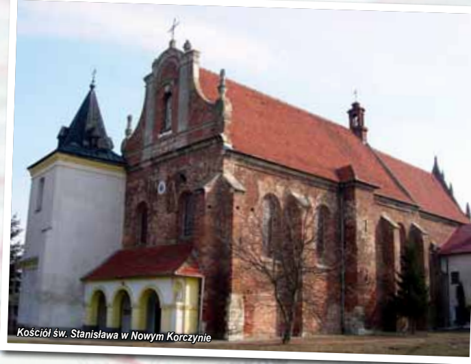
Kościół św. Stanisława w Nowym Korczynie

Dominującą nad miejscowością budowlą był monumentalny zamek królewski , przy którym znajdowały się budynki gospodarcze (browar, stajnie, gorzelnia i łaźnia). Zamek posiadał również własny wodociąg. Centrum