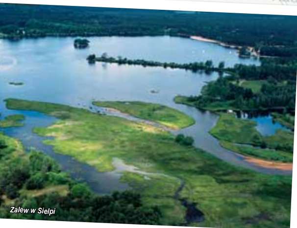
Zalęw w Sielpi

boiska, korty tenisowe, plac zabaw, kino letnie, zachęcają do aktywnego spędzania wolnego czasu. Rozbudowane zaplecze noclegowe oraz gastronomiczne umożliwia dłuższe pobyty wypoczynkowe.