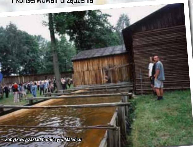
Zabytkowy zakład hutniczy w Maleńcu