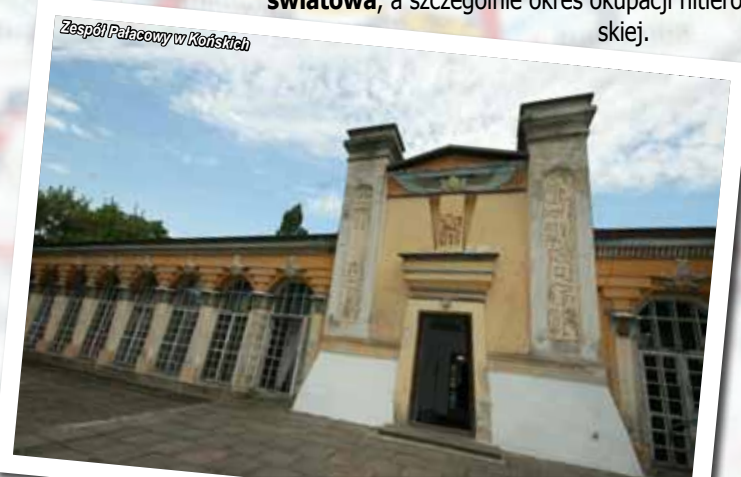
Zespół Pałacowy w Końskich

Okres I wojny światowej oraz międzywojnia był dla miasta czasem stagnacji. Wielkie piętno na historii miasta odcisnęła natomiast II wojna światowa , a szczególnie okres okupacji hitlerowskiej.