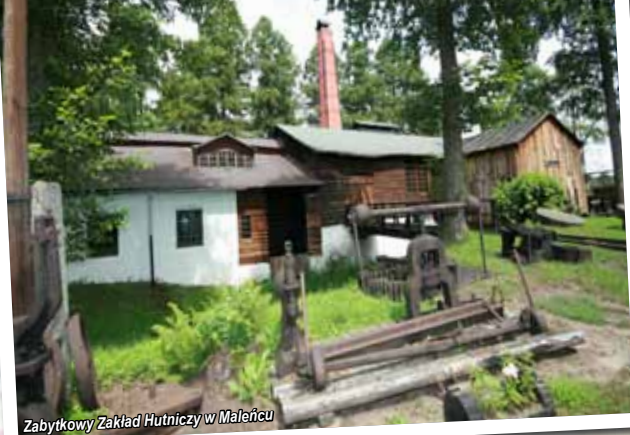
Zabytkowy Zakład Hutniczy w Maleńcu

ratując ten „cud techniki” przed zniszczeniem. Obecnie zakład znajduje się pod społecznym patronatem Politechniki Śląskiej oraz Muzeum Techniki NOT z Warszawy.