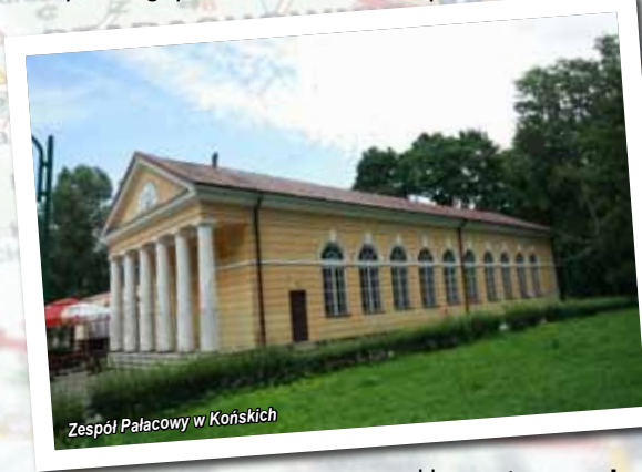
Zespół Pałacowy w Końskich

Powstał w latach 40-tych XVIII w. z inicjatywy Jana Małachowskiego . Plany obejmowały pałac główny, wraz z przylegającymi do niego skrzydłami. W pierwszej kolejności powstały skrzydła boczne , zaś główny budynek nigdy nie został zbudowany.