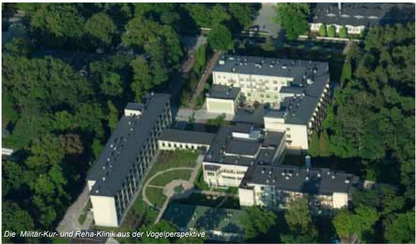
Die Militär-Kur- und Reha-Klinik aus der Vogelperspektive

21. Wojskowy Szpital Uzdrowiskowo-Rehabilitacyjny ul. F. Rzewuskiego 8, 28-100 Busko-Zdrój Information und Reservierung für Privatpatienten: Tel. 041 378 03 85, E-mail: rezerwacja@21wszur.pl Tel. (Rezeption, Zentrale): 041 378 24 17, www.21wszur.pl