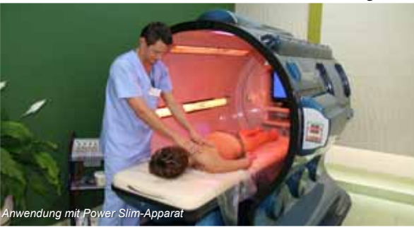
Anwendung mit Power Slim-Apparat

POWER SLIM ist eine Apparatur, bei der Infrarot-Strahlung kombiniert mit Elektrostimulation zu Heilzwecken sowie zur Abmagerung, zur Verbesserung der Figur und zur Reduzierung von Cellulite genutzt werden.