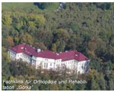
Fachklinik für Orthopädie und Rehabilitation „Górka“

Die Reha-Klinik „Górka“ ist ein hochmodernes, umfassend ausgestattetes Haus für die Behandlung von Kindern und Erwachsenen. Den Kurgästen steht ein engagiertes Team mit hoher und langjähriger therapeutischer Erfahrung zur Verfügung. Unser Spezialgebiet ist die Implantation von Knie- und Hüftgelenkendoprothesen sowohl für versicherte wie auch für Privatpatienten. Darüber hinaus sind wir in Polen führend bei der Behandlung von zerebraler Kinderlähmung. Unsere Klinik erteilt umfassende Leistungen, so dass alle bei uns operierten Patienten vor