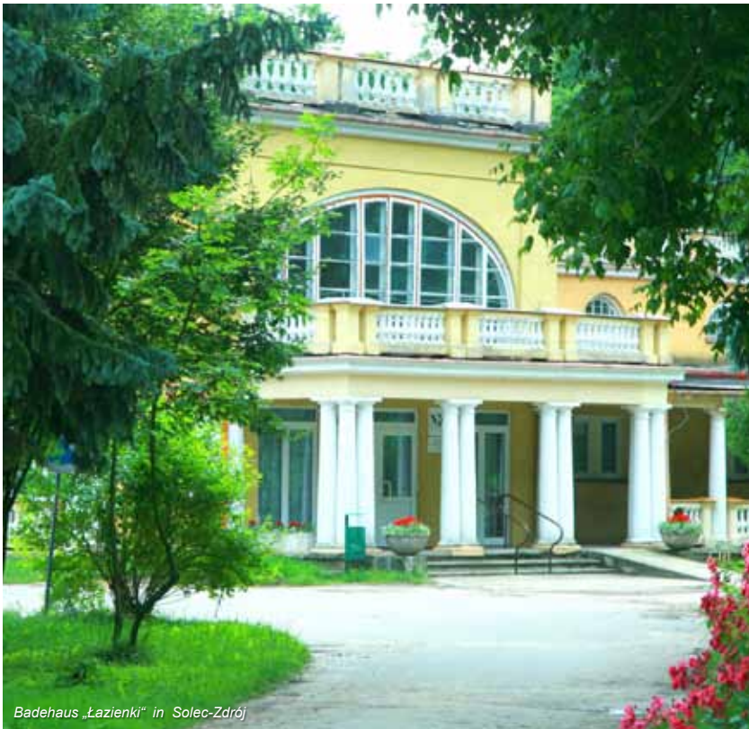
Badehaus „Łazienki“ in Solec-Zdrój