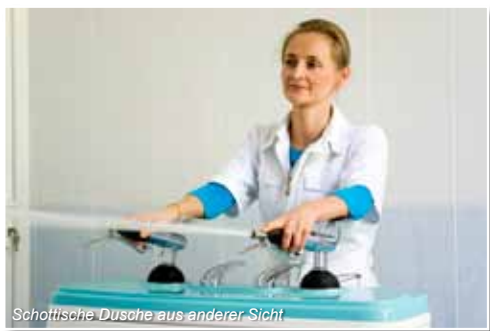
Schottische Dusche aus anderer Sicht

mit Friseur- und Kosmetiksalon sowie Spa-Anwendungen zur Verfügung. Für angenehmen Zeitvertreib und Erholung sorgen außerdem das Café und Restaurant (Tanzabende), der hübsche Garten und die gemütliche Grillstelle.