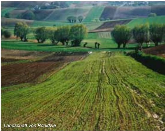
Landschaft von Ponidzie

Wenn man sich in die Gegend von Nowy Korczyn begibt, fühlt man sich geradezu in die französische Provence versetzt, denn auch hier erstrecken sich weite, duftende Lavendelfelder. Ein Beutelchen Lavendel ist stets ein willkommenes Mitbringsel, und die Lavendelfelder garantieren kostenlose Aromatherapie.