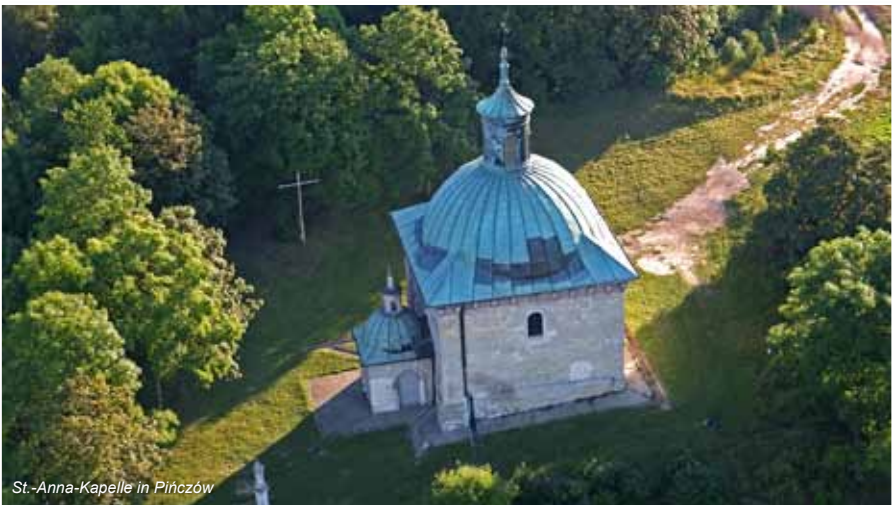
St.-Anna-Kapelle in Pińczów