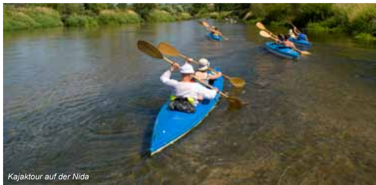
Kajaktour auf der Nida

Nach der Weltgesundheitsorganisation ist die Gesundheit des Menschen „ein Zustand des vollständigen körperlichen, geistigen und sozialen Wohlergehens und nicht nur das Fehlen von Krankheiten oder Gebrechen“.